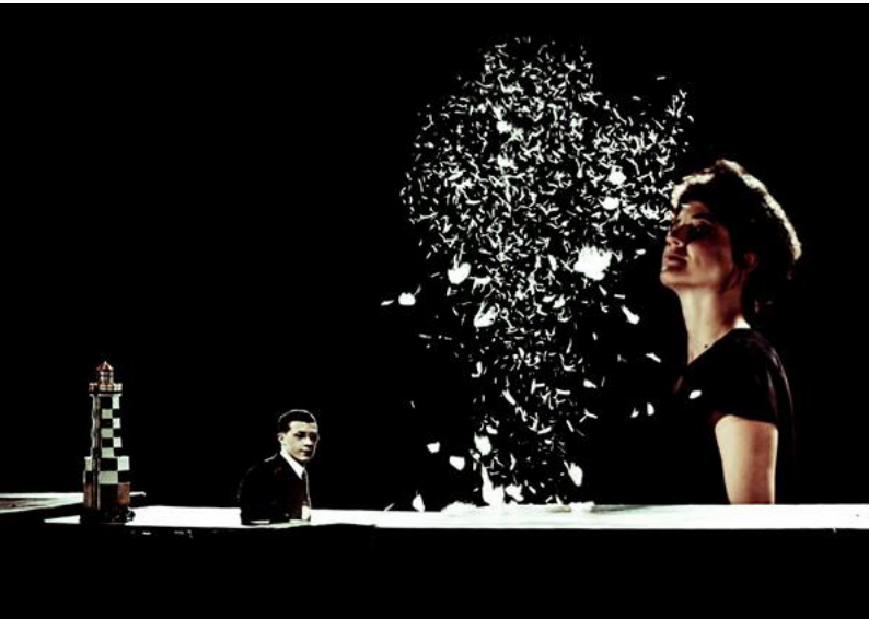
Une Chair Périssable 2015 théâtre de matière à partir de 16 ans