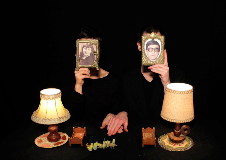
Volatiles et Féculents 2012 entresorts de théâtre d'objets tout public