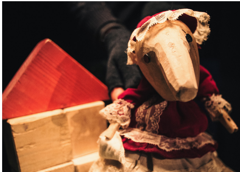
M.Jules, l'épopée stellaire 2014 théâtre d'objets tout public